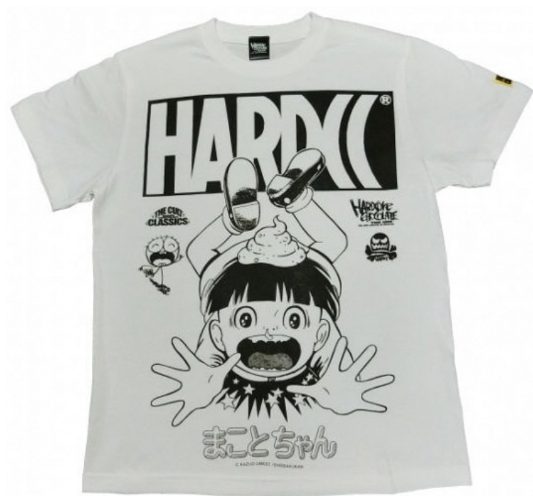
まことちゃん・復刻版（聖秀ホワイト）価格：4400円（税込）