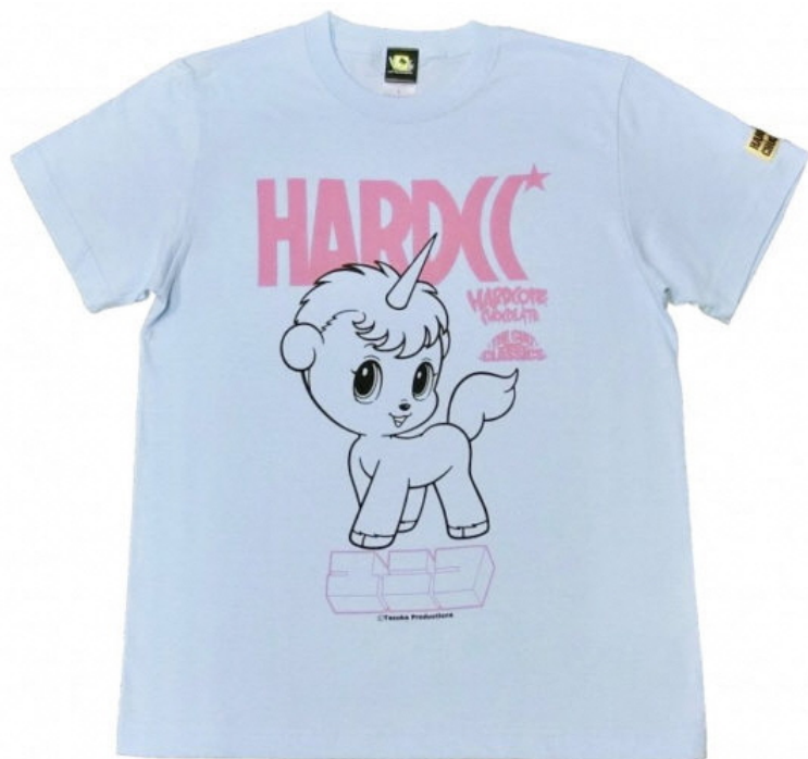
ユニコ（一角獣ライトブルー）価格：4400円（税込）