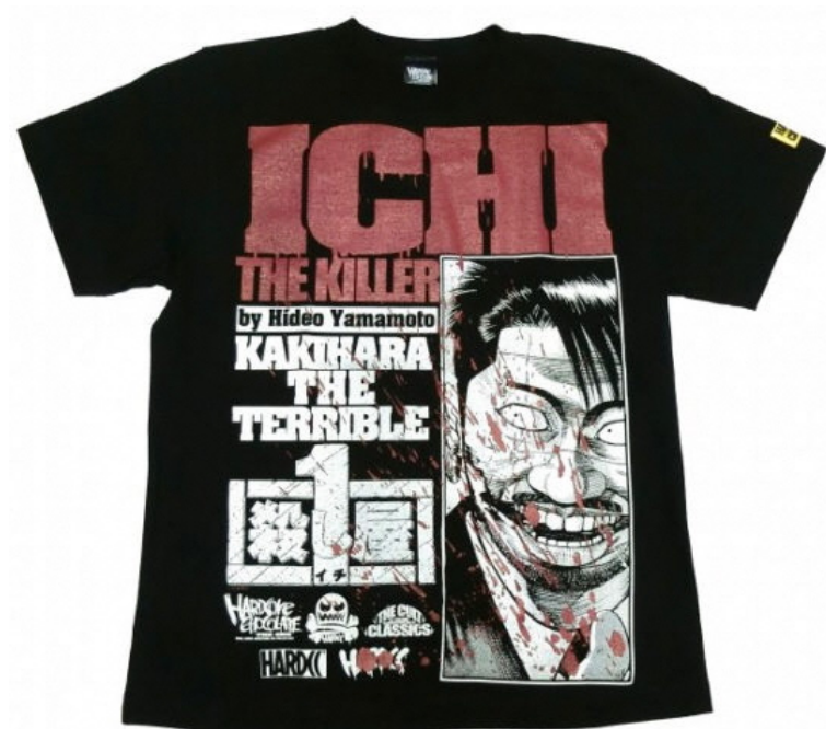
殺し屋1 2021バージョン:KAKIHARA THE TERRIBLE（垣原）価格：4400円（税込）

PAC-MAN™&©BANDAI NAMCO Entertainment Inc.