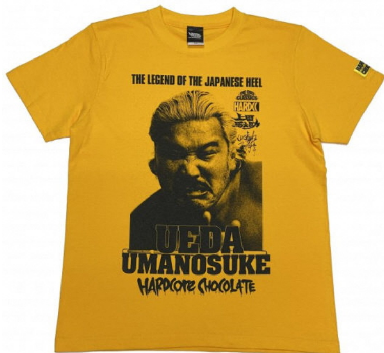
上田馬之助:まだら狼 (クロスチョップゴールド) 価格 : 4400円 (税込)