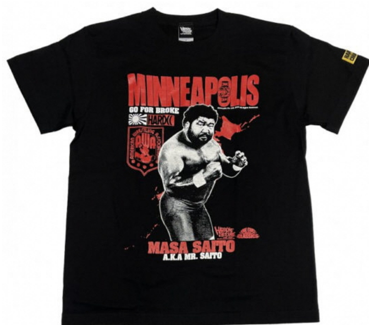
MINNEAPOLIS (マサ斎藤) 価格 : 4400円 (税込)