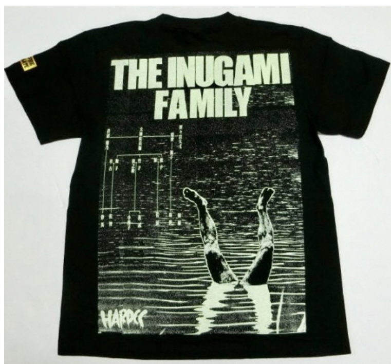
「犬神家の一族(THE INUGAMI FAMILY)」上：表・下：裏 価格：4400円（税込）