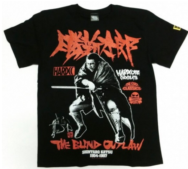
勝新太郎 -THE BLIND OUTLAW- (裏街道ブラック) 価格：4400円（税込）