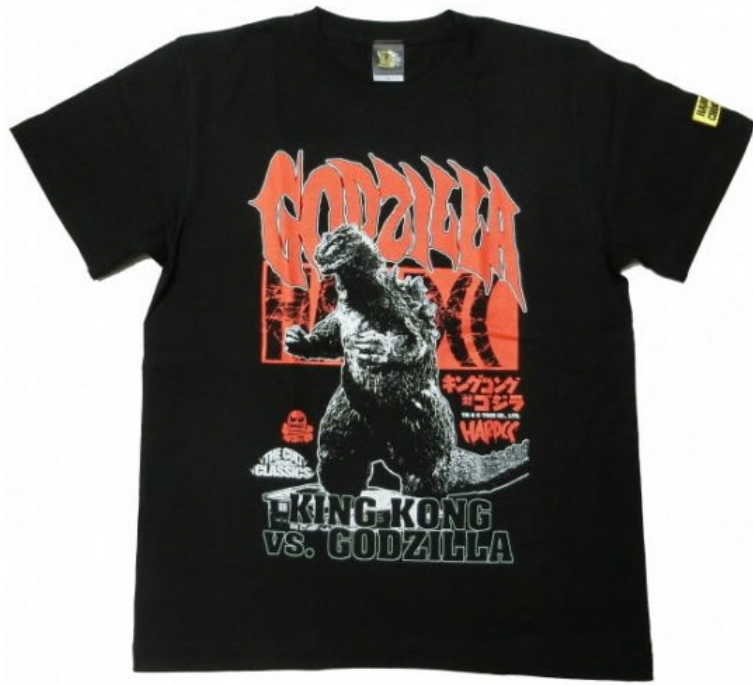
ゴジラ（中禅寺ブラック） 価格：4400円（税込）

もちろん上記オススメ以外にも、いろんなコンテンツがデザインされた“コアチョコ”自慢のTシャツたちが店内には並んでいます。どれも唯一無二！ほんの一部ですがご紹介します。