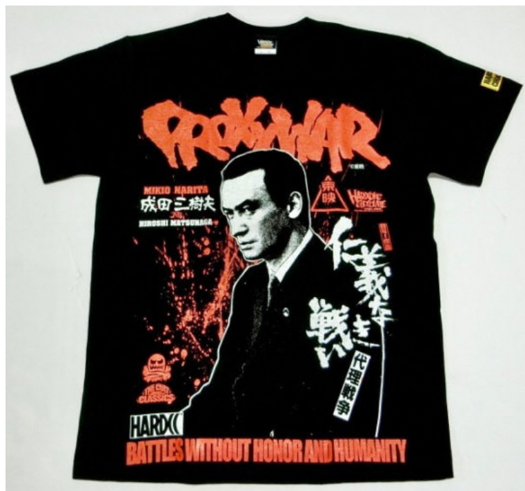
仁義なき戦い 代理戦争-成田三樹夫- 価格：4400円（税込）