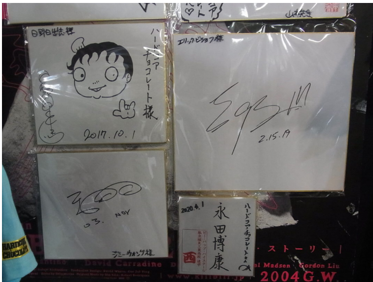
左上：漫画家・日野日出志氏 右上：元WCW副社長 エリック ビショフ氏