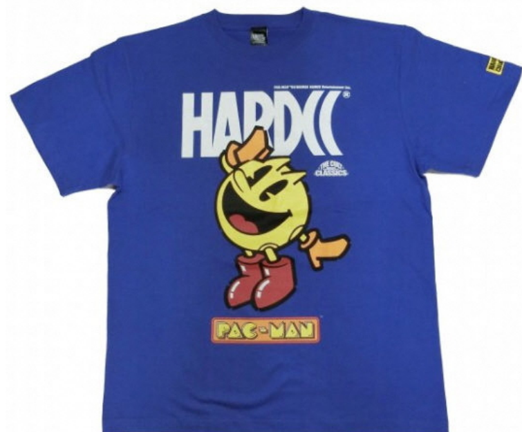
パックマン×HARDCC・ILLUSTRATION（ロイヤルブルー）価格：4400円（税込）

PAC-MAN™&©BANDAI NAMCO Entertainment Inc.