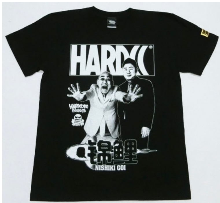
錦鯉 (SMAブラック) 価格 : 4400円 (税込)