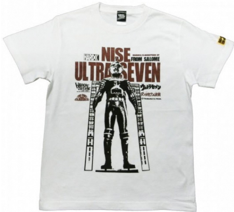
ニセ・ウルトラセブン（ロボット超人ホワイト）-復刻版- 価格：4400円（税込）

もちろん上記オススメ以外にも、いろんなコンテンツがデザインされた“コアチョコ”自慢のTシャツたちが店内には並んでいます。どれも唯一無二！ほんの一部ですがご紹介します。